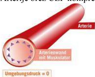
Slika 1: Arterije brez CEP kompresije