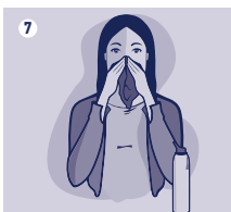
Odrasli in otroci