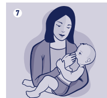
Dojenčki in otroci, ki potrebujejo pomoč